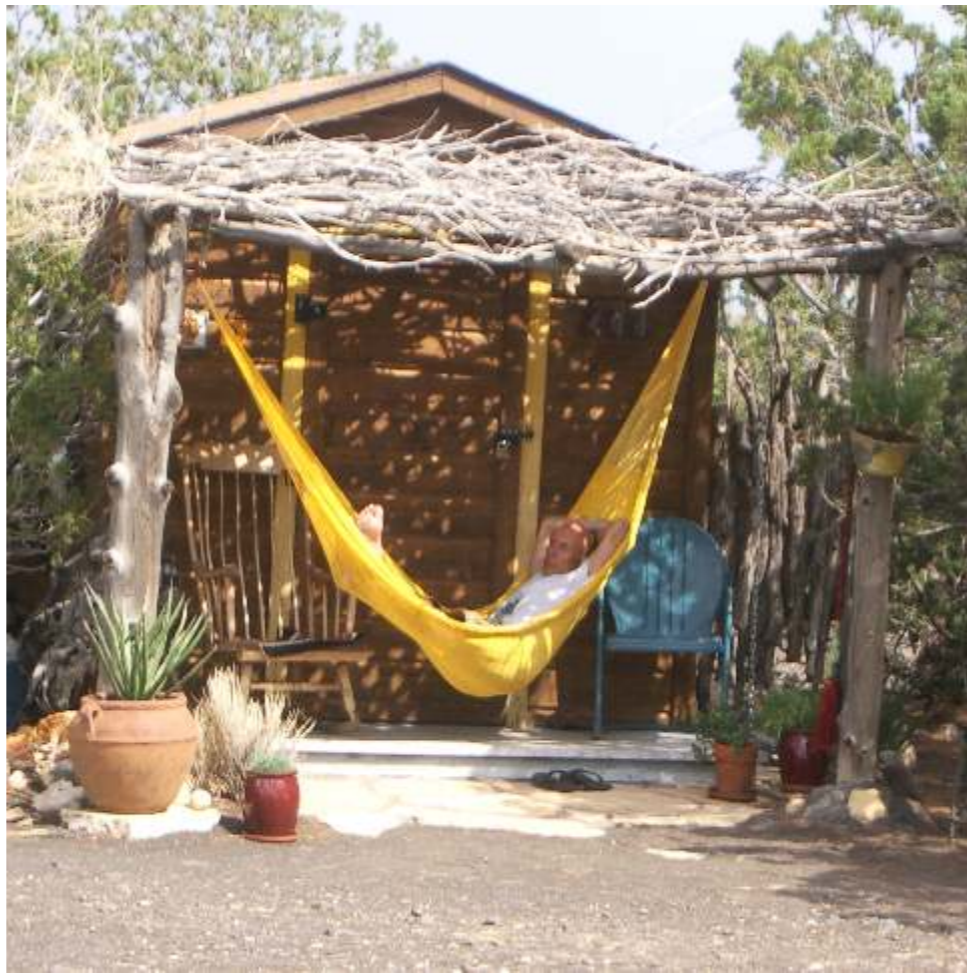
Hut, 2016, Foto, 65 x 65 cm / Колиба, 2016, фотографија, 65 x 65 cm